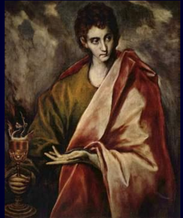
Saint-Jean par Le Gréco